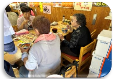
7/25 第4回学習会の様子