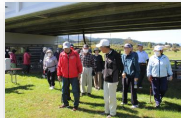
10/11 第5回パークゴルフ大会 表彰式の様子