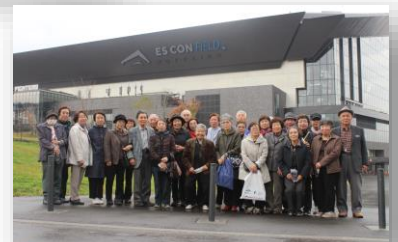
10/19 修学旅行 エスコンでの集合写真