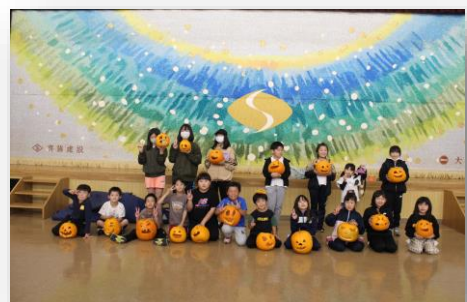
10/18 かぼちゃランタン作り 集合写真