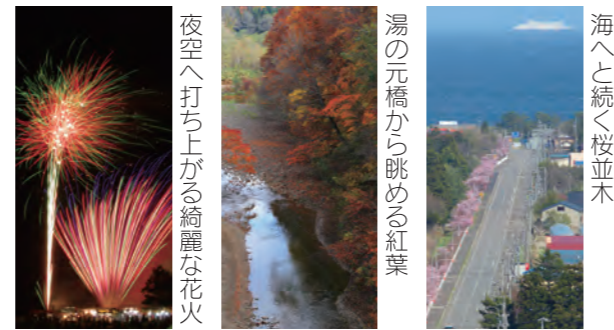
夜空へ打ち上がる綺麗な花火