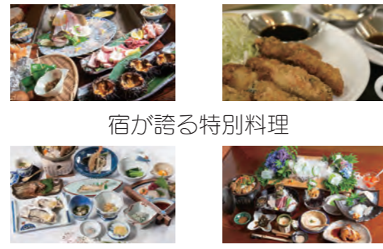
宿が誇る特別料理