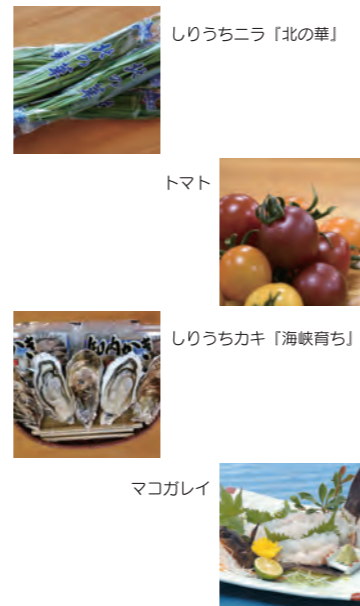
しりうちニラ「北の華」