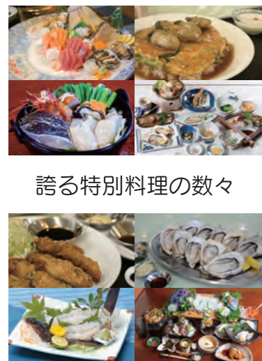
誇る特別料理の数々