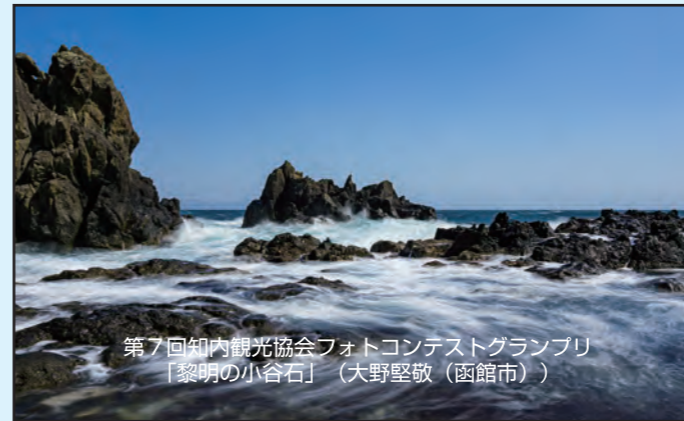
第7回知内観光協会フォトコンテストグランプリ 「黎明の小谷石」(大野堅敬(函館市))