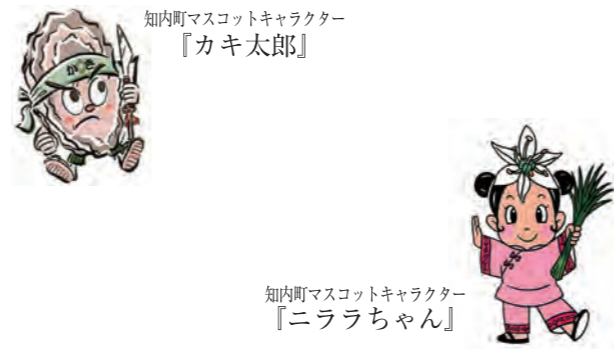
知内町マスコットキャラクター『カキ太郎』