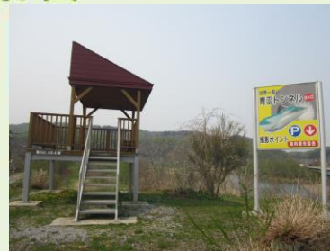
青函トンネル撮影台

知内町には、北海道と本州を結ぶ青函トンネルの出入口があり、トンネルから列車や新幹線が出てくる瞬間は最高です。初夏にはアジサイの花が綺麗に咲く観光スポットです。