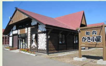
かき小屋知内番屋

知内町の特産品である、ニラやカキを使用した本格中華料理を堪能できます。入口付近には、備蓄品が販売されています。