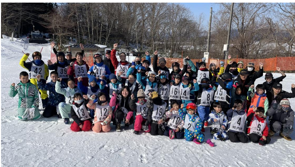
第16回知内ジュニアスキー技術選手権大会（令和6年2月18日）