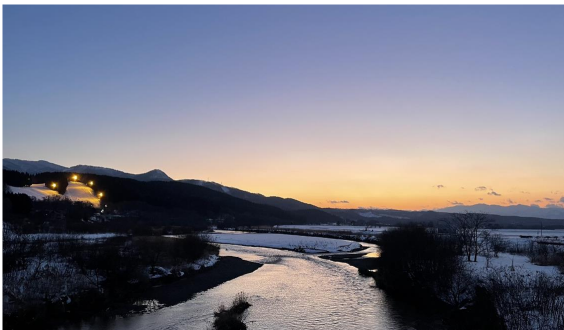
夕暮れの知内川と知内町営スキー場