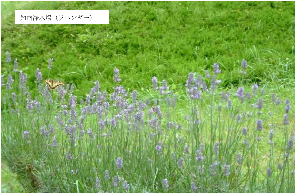
知内浄水場（ラベンダー）