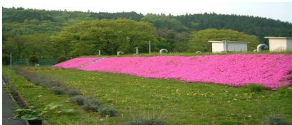
(写真：知内浄水場ラベンダーと芝桜)