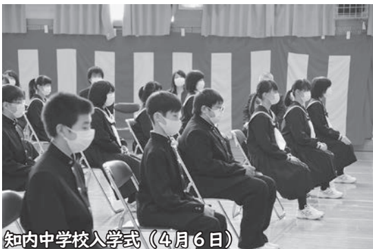
知内中学校入学式 (4月6日)