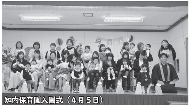
知内保育園入園式 (4月5日)