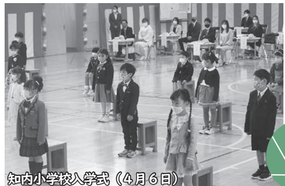
知内小学校入学式 (4月6日)