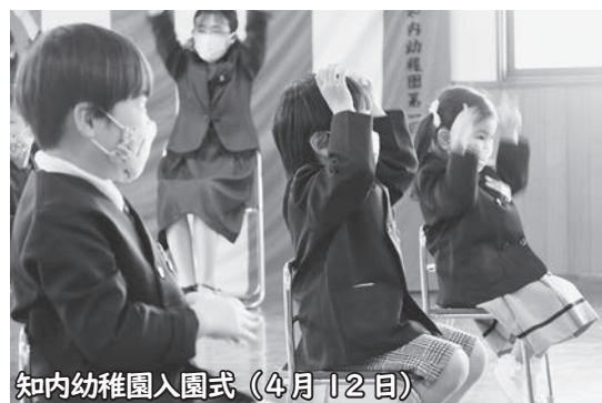
知内幼稚園入園式(4月12日)

令和3年広報しりうち4月号P26記載の求人情報について、上記事業所の賃金欄に誤りがありましたので、お詫びして訂正いたします。