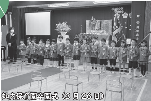
知内保育園卒園式 (3月26日)