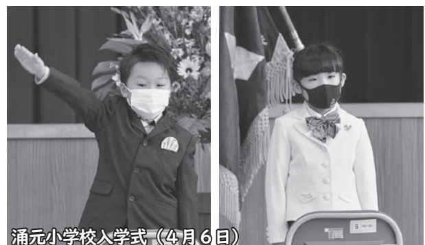
涌元小学校入学式(4月6日)