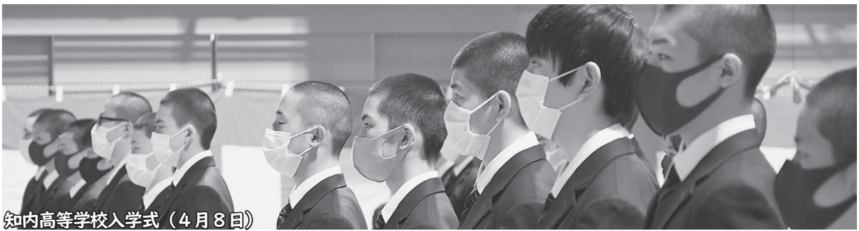
知内高等学校入学式 (4月8日)